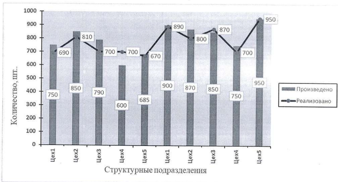
Рис.1. Выпуск продукции и ее реализация