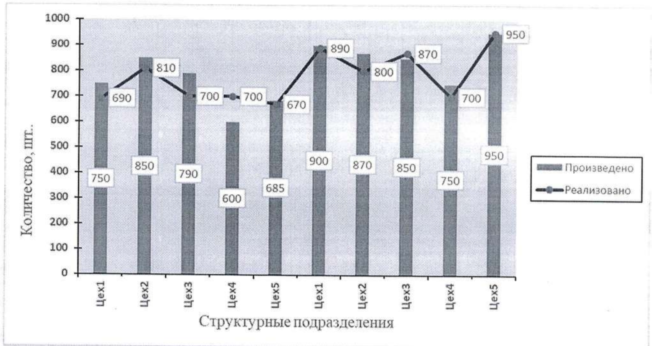
Рис.1. Выпуск продукции и ее реализация