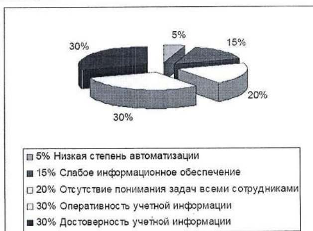
Рис. 1.1. Доли факторов, влияющих на эффективность документооборота, %

Факторы, влияющие на эффективность документооборота, представлены на рисунке 1.1.