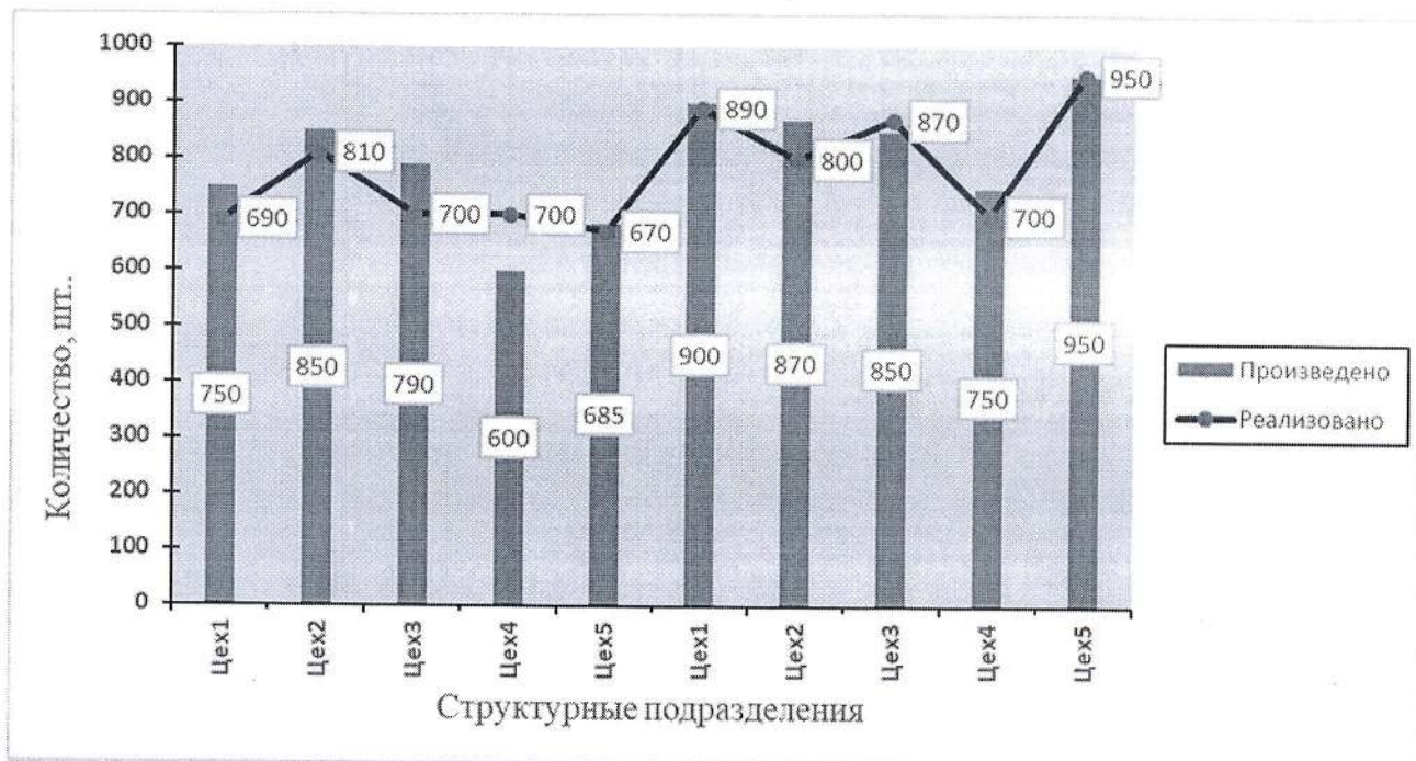
Рис.1. Выпуск продукции и ее реализация