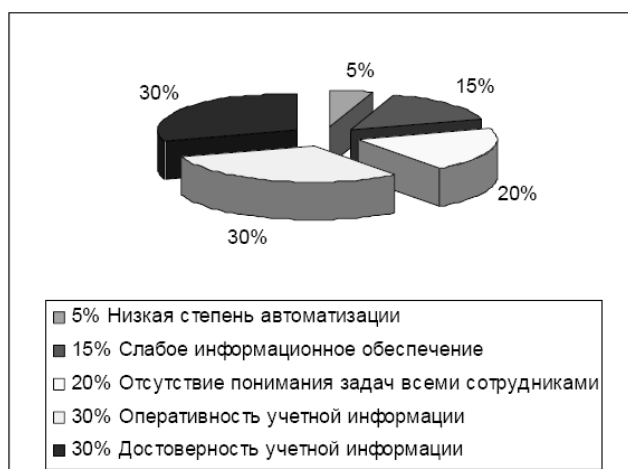
Рис. 1.1. Доли факторов, влияющих на эффективность документооборота Источник: [Теория и практика..., с. 177].

Факторы, влияющие на эффективность документооборота, представлены на рисунке 1.1.