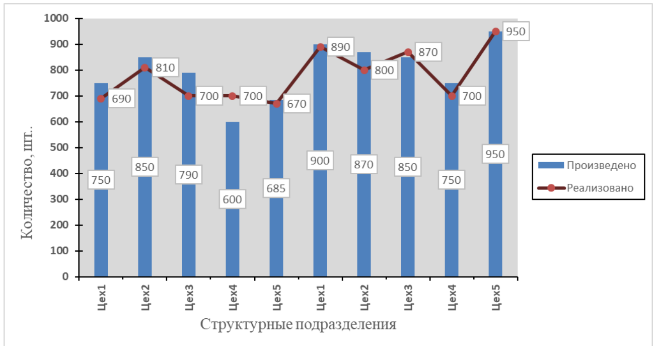
Рис.1. Выпуск продукции и ее реализация