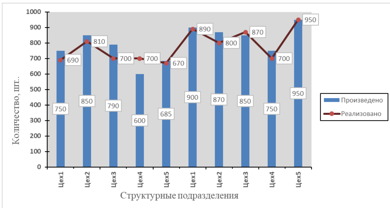
Рис.1. Выпуск продукции и ее реализация