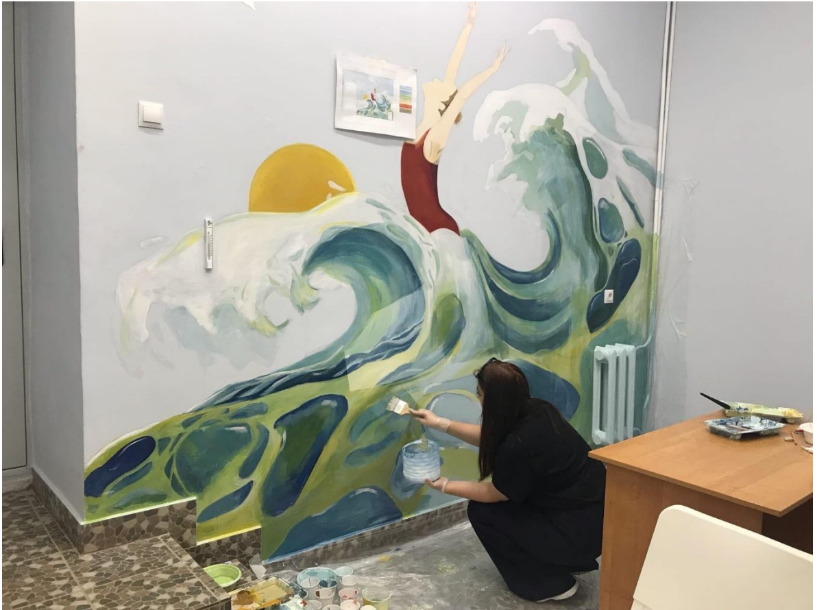
Этап фиксирования композиции защищающим лаком