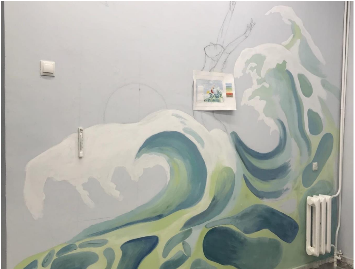
Этап нанесения больших по площади участков с помощью краски