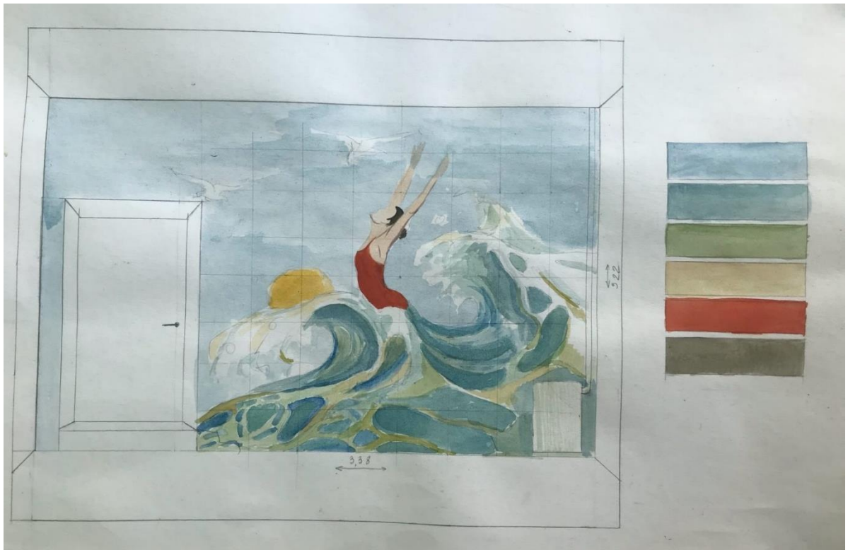
Эскиз будущей росписи