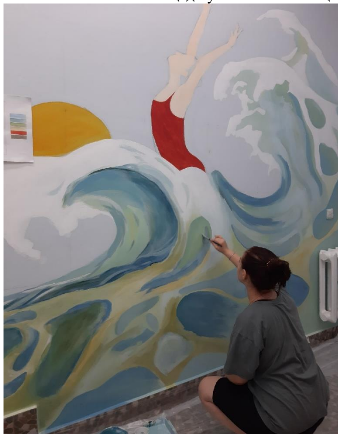
Этап прорисовки деталей изображения