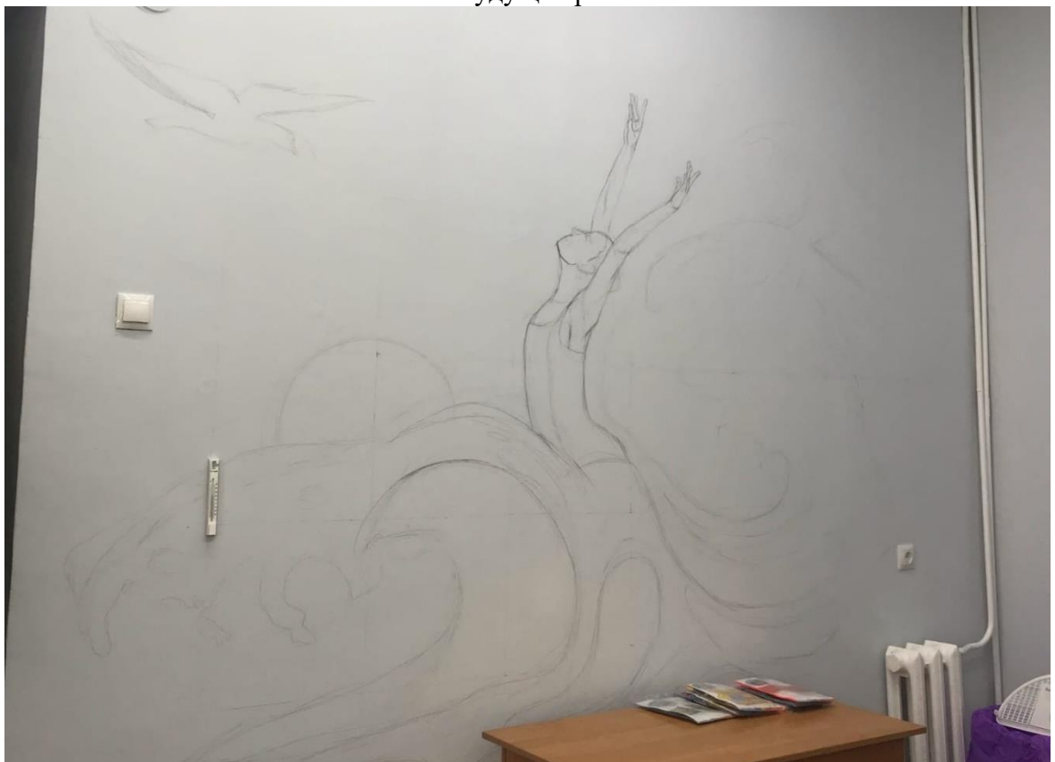
Линейная прорисовка композиции