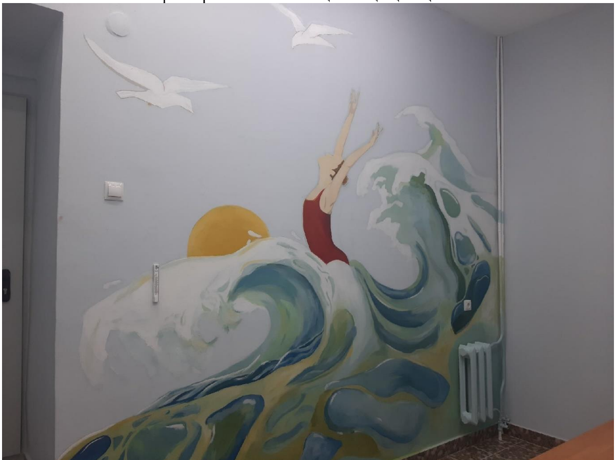
Итоговая композиционная работа