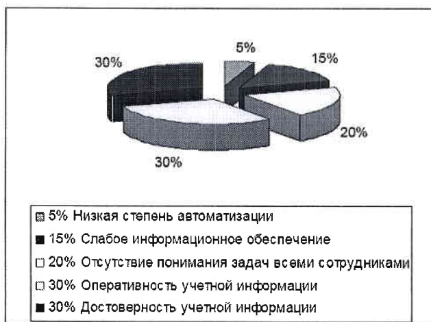
Рис. 1.1. Доли факторов, влияющих на эффективность документооборота, %