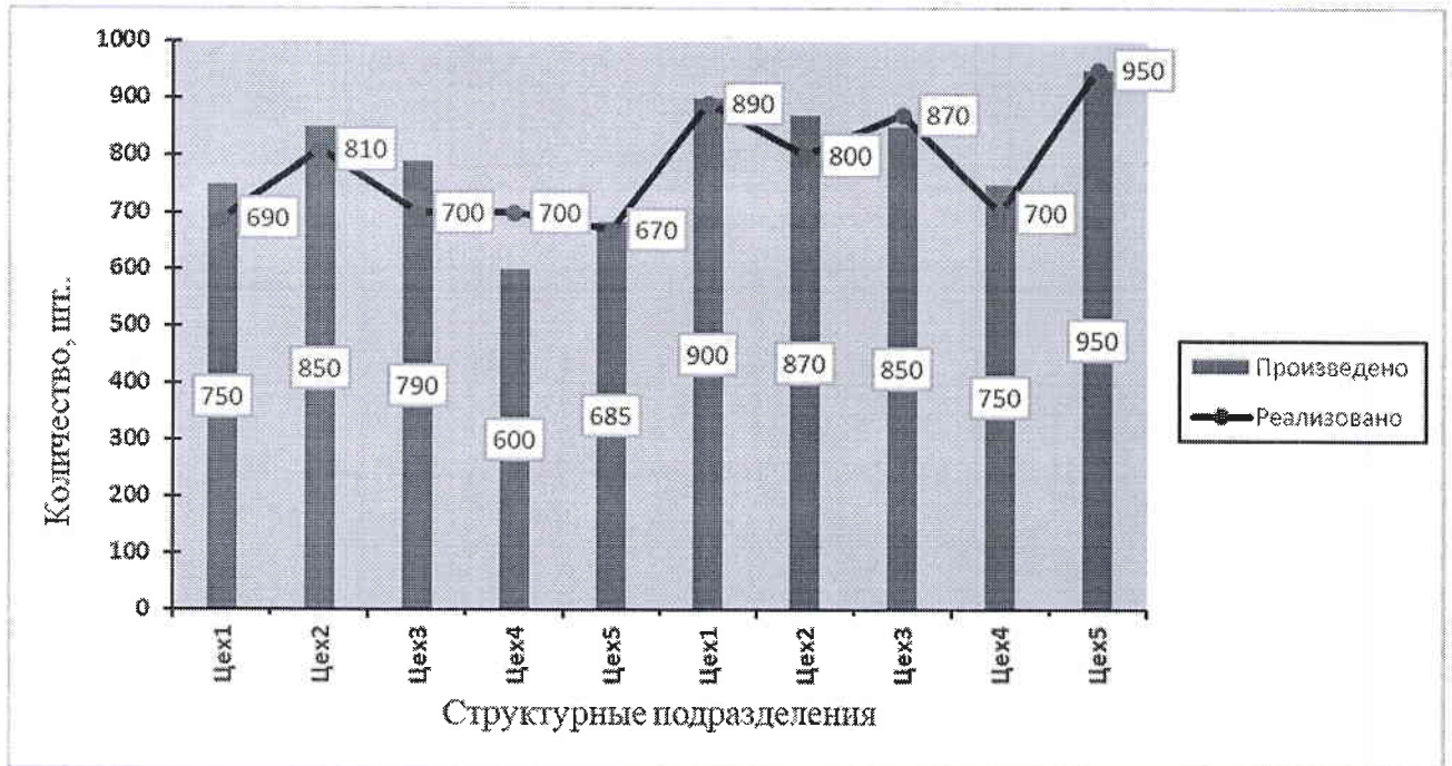
Рис.1. Выпуск продукции и ее реализация